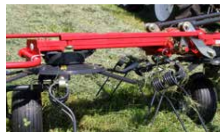
Okvir iz kvadratnega profila za težke delovne razmere, ki hkrati ščitijo pogonske sklope.