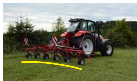
Prikaz odličnega prilagajanja terenu.