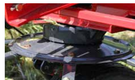
Zaprt kotni prenos na rotorje, kar zagotavlja minimalno vzdrževanje in dolgo življensko dobo.