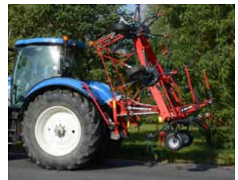
Z 765 PRO