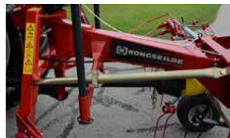
Stabilizator zagotovi mirno delovanje stroja.