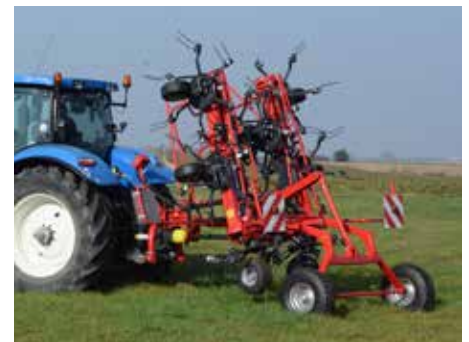
Z 8805 T