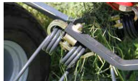
Varovala vzmetnih prstov.