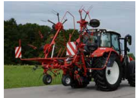
Z 665 HYDRO