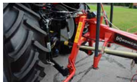
Gibljiv 3 – točkovni priklop zagotavlja odlično sledenje tlem.