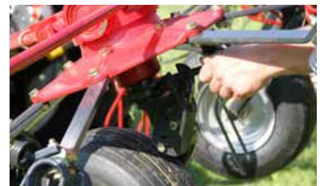
Wegwerken van gewas van perceelranden