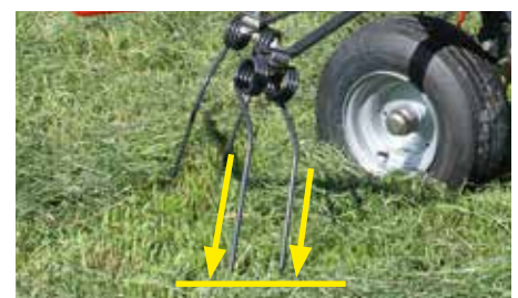
Asymmetrische dubbele tanden