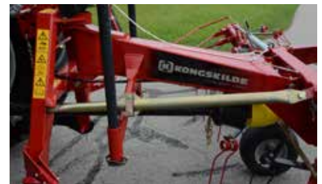
Stabilisatiestangen zorgen voor een rustig werkende machine