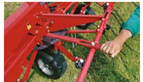
Kantschudden van gewas bij perceelsranden met de Pro-serie