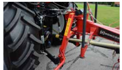
Scharnierende naloopbok zorgt voor perfecte bodemvolgung