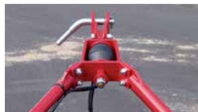
Protezione in gomma per preservare l'attrezzo ed il trattore.