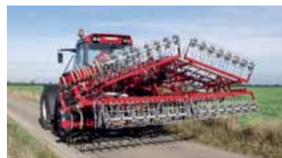
Ripiegamento totale delle estensioni.