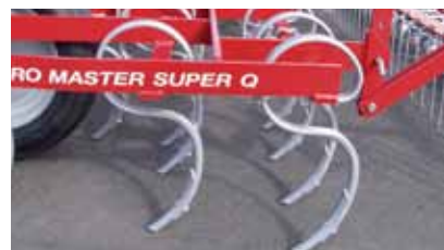
Dente a SQ con punta reversibile super.

Sia l'SGC che il Super Q possono essere forniti in versione trainata.