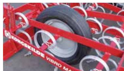
Gomme 165 x 15" standard su SQ. Gomme 6.00 x 12" standard su SGC.