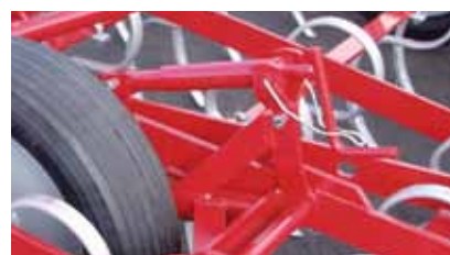
Sistema di regolazione profondità.