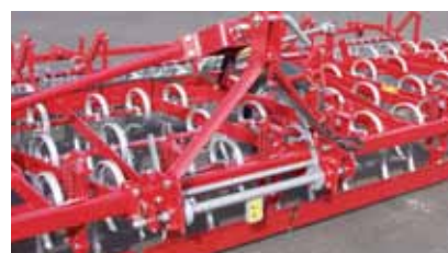
Attacco rapido semi-automatico.