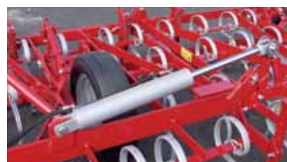
Sistema idraulico delle estensioni laterali.