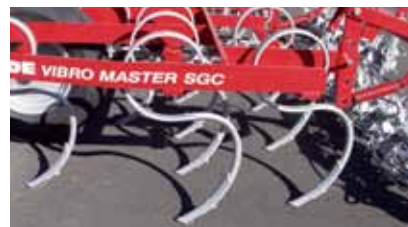
Dente a S con punta reversibile Super.

Tutti i punti di attacco dei vari accessori previsti sono già fissati sul telaio centrale allo scopo di evitare qualsiasi difficoltà qualora vengano montati successivamente.