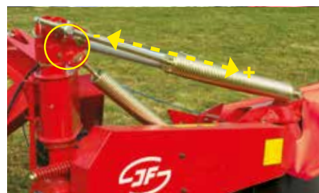
Nastavení odlehčení – přitlaku na půdu