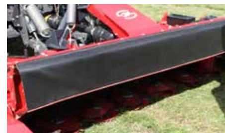
Snadný přístup k žací liště SMF