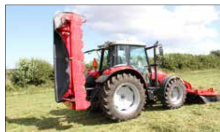
SB v transportní poloze

Nárazová pojistka: všechny stroje řady SB jsou vybavené mechanickou pojistkou chránící stroj v případě nárazu na překážku