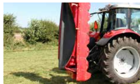
Vertikální transportní poloha

Pohon klínovými řemeny snižuje vibrace a rázy a tak jsou chráněné ostatní převody. Tak je zajištěn spolehlivý a efektivní přenos hnací síly.