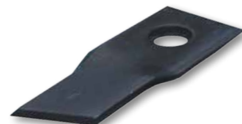
Kroucený žací nůž