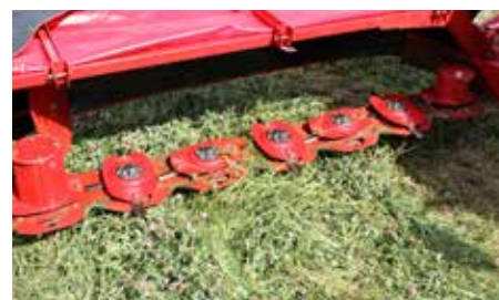
Plochá žací lišta