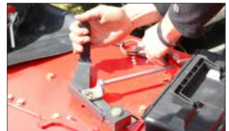
Snadné nastavení řádkovacích disků shora