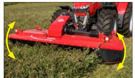
Pohyblivý závěs umožňuje perfektní kopírování povrchu terénu