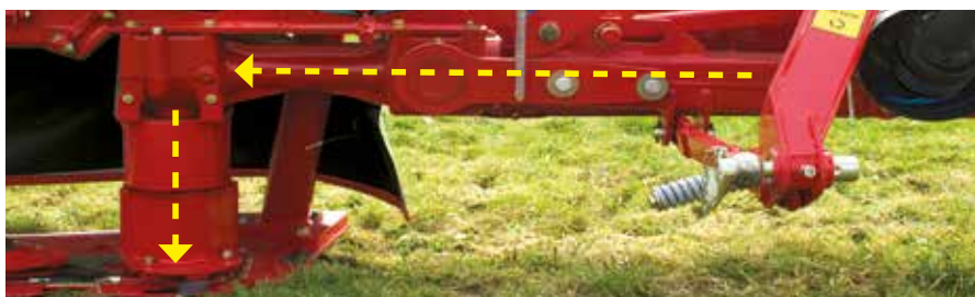
Pohon klínovými řemeny