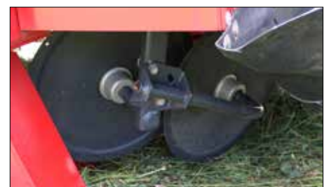
Zdvojené řádkovací disky jsou standardní výbavou