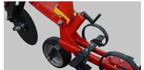
Podešavanje dubine pomoću vretena.