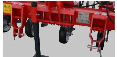
Nezavisno pomerljive tačke kačenja.

Izmena rastojanja između sekcija je vrlo jednostavna. Podešavanje međurednog razmaka se obavlja samo jednim vijkom po sekciji.