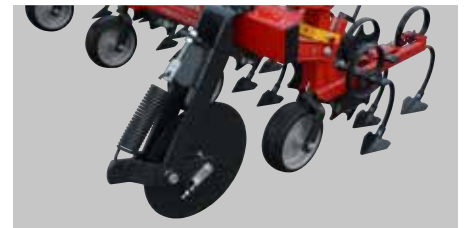
Opružno oslonjeni stabilizatorski diskovi.

Vrlo malo ali moćno vibriranje rezultira poboljšanim efektom čišćenja, uzrokujući minimalno bočno bacanje zemlje.