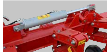
Patentiran sistem za zaključavanje i otključavanje.