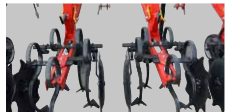
Sekcija za međuredni zahvat od 55 - 80 cm ima 5 motičica.