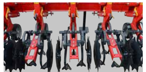
Sekcija za međuredni zahvat od 45 - 55 cm ima 3 motičice.