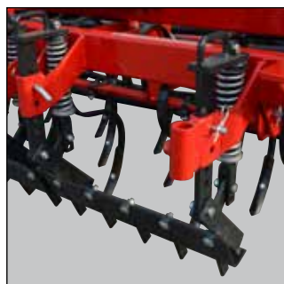
3-delt slæbeplanke med tænder.