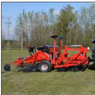
Hydraulisk såmaskineophæng, arbejdsposition.