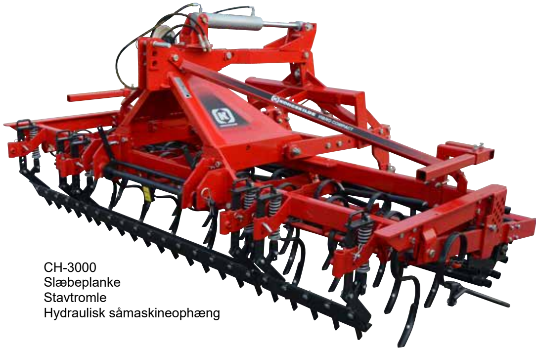
CH-3000 Slæbeplanke Stavtromle Hydraulisk såmaskineophæng