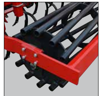
Stavtromle med 12 stave.