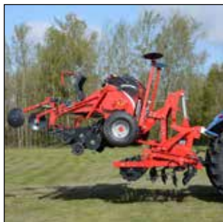
Hydraulisk såmaskineophæng, transportposition.