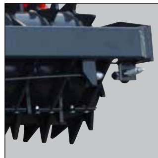
Individuelle justerbare skraberblade.