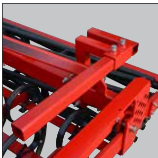
Støttebeslag til såmaskine.