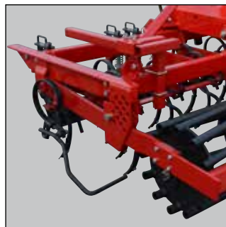
Dybdejustering med splitbolte.