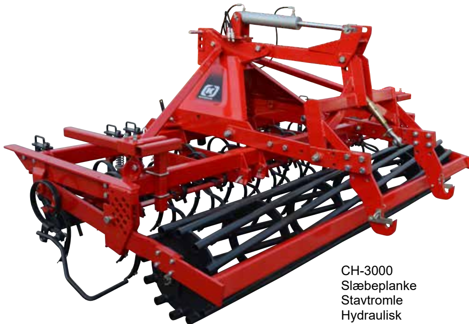
CH-3000 Slæbeplanke Stavtromle Hydraulisk såmaskineophæng

Kongskildes Vibro Compact er pulvermalet og har få bevægelige dele, der kun kræver minimal vedligeholdelse. Derfor holder Vibro Compact sin værdi mange år frem i tiden.