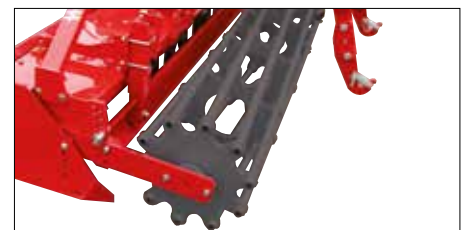
Hintere Planierschiene (Zubehör).