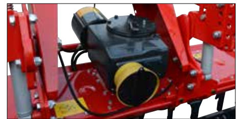
3-Gang Schaltgetriebe mit Zapfwelldurchtrieb.

Verschiedene Nachlaufwalzen, vordere bzw. hintere Planierschiene, Kombi-Hitch und ein großes Zubehörprogramm runden die Ausrüstungspalette für die HK 31 ab.