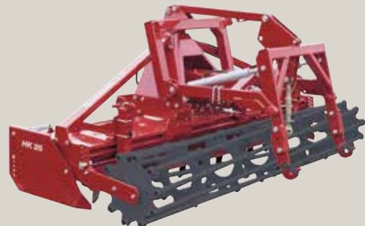
HK 25 mit Stabwalze und hydraulischer Kombi- Hitch (Zubehör)

Die HK 25 ist eine Kreiselegge für mittlere Betriebe und für Schlepper bis 95 kW (130 PS). Diese Kreiseleggenbauweise von Kongskilde ist tausendfach im langjährigen Einsatz bewährt. Die Maschine wurde weiterentwickelt, so daß sie den Ansprüchen moderner Betriebe gerecht wird und optimal mit modernen Schleppern und Drillmaschinen arbeiten kann.