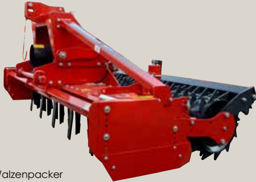
HK 31 mit Walzenpacker