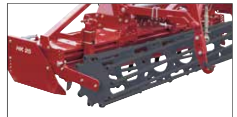
Tiefeneinstellung und Planierschiene.

Verschiedene Nachlaufwalzen, vordere bzw. hintere Planierschiene, Kombi-Hitch und ein großes Zubehörprogramm runden die Ausrüstungspalette der HK 25 ab.