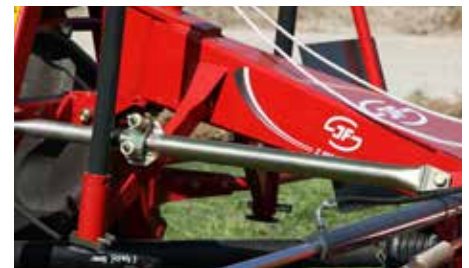
Støddæmpere giver rolig kørsel.