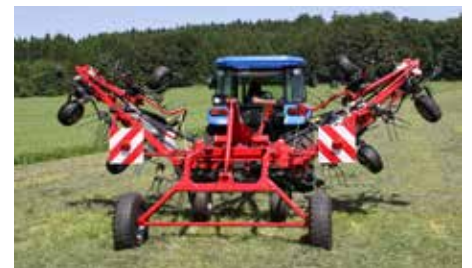
Z 8805 T under sammenklapning til transportstilling.