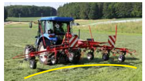
Altid optimeret terrænfølgning.