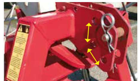
Artikuleret 3-punktsophæng giver en perfekt terrænfølgning.