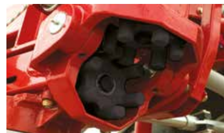
Finger Link kobling består af 2 x 6 kraftige fingre. Finger Link giver en drivlinie. Rotorerne kan derfor uden problemer rotere, f.eks. imens de løftes fra jorden ved vending på forager.