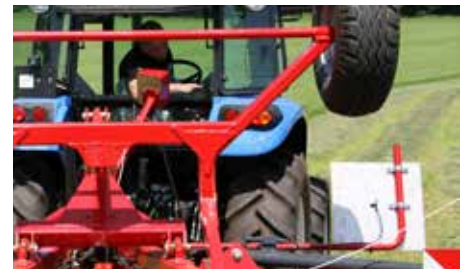
Godt udsyn fra traktorkabinen til rotorvenderen mens der arbejdes i marken.