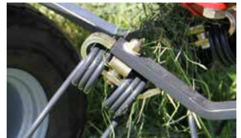
Sikring af rivefjedre