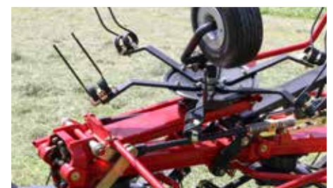
Z 8805 T sammenklappet venderarm og sikkerhedsbøjle.