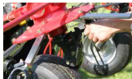
Kantrømningjustering sker via et håndtag på de to midterste hjul.