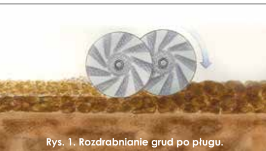
Rys. 1. Rozdrabnianie grud po pługu.