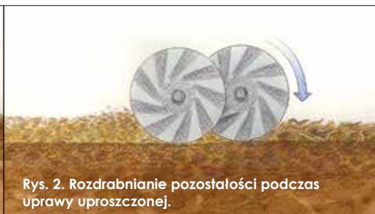
Rys. 2. Rozdrabnianie pozostałości podczas uprawy uproszczonej.