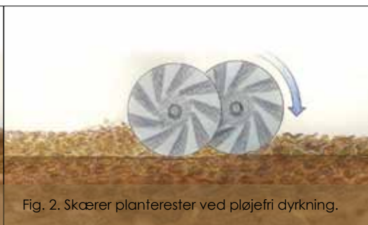
Fig. 2. Skærer planterester ved pløjefri dyrkning.