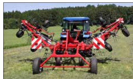
Z 8805T při sklápění