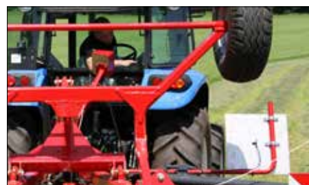
Z kabiny traktoru může obsluha snadno kontrolovat pracovní polohu.