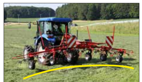
Kopírování povrchu terénu