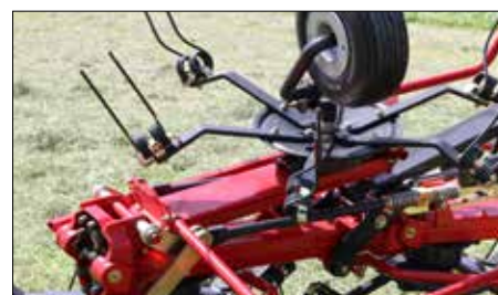
Z 8805T po sklopení