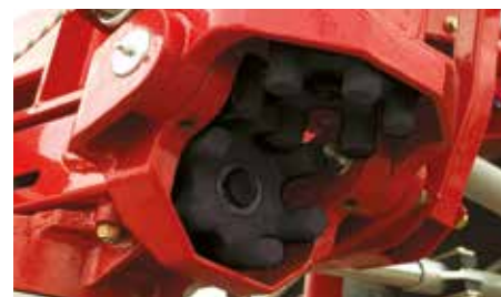
Spojky „Finger Link“ přenášejí hnací sílu mezi rotory