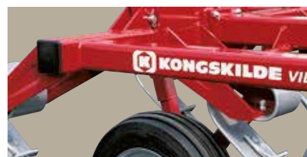
VF 2000 / 4200 / 4300 / 4000 Stærk opbygning med firkantrør.