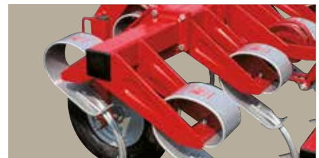
VF 2000. Sidefløjene er påboltet.