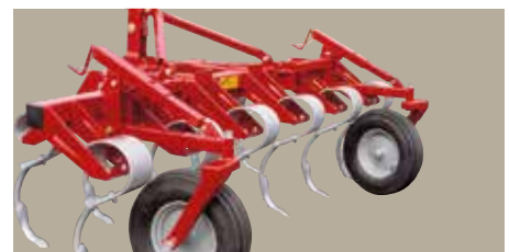
VFF 2011 Frontmontering giver mulighed for kombination af flere redskaber.