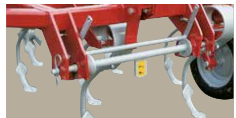
VF 2000 / 4200 / 4300 / 4000 Snapkobling med bæreaksel til hurtig til- og frakobling.

VFF-2011 er som standard forsynet med store drejelige hjul for at lette styringen af traktoren. Et specielt beslag i topstangsfæstet sikrer traktorens frontlift og harven mod overbelastning. .