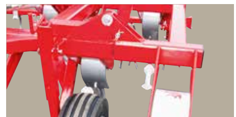
VF 4200 / 4300 / 4000 Gummihjul 6.00 x 12" med spindelindstilling er standard.