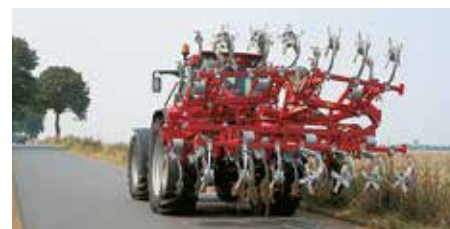
VF 4200 / 4300 / 4000 Sidefløjene foldes helt ind over midterrammen.