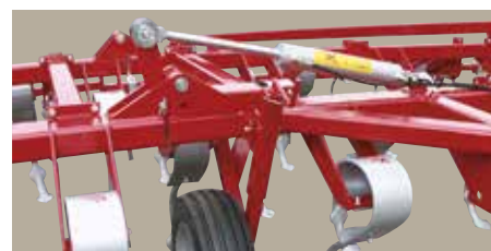
VF 4200 / 4300 / 4000 Sammenklappelig med dobbeltvirkende hydraulikcylindre.

VF 4000 kan ombygges til bugseret udgave. Hoveddrammen forsynes med et specielt hjularrangement til både dybdekontrol og vejtransport. Trækar-rangementet monteres i 3-punkts-ophæng.