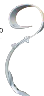
VF 2000 / 4200 / 4300 / 4000 VF-tand med 6,5 cm vendbart ultra grubberskær.