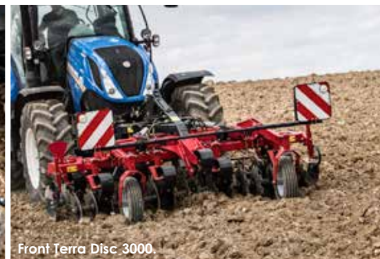
Front Terra Disc 3000.