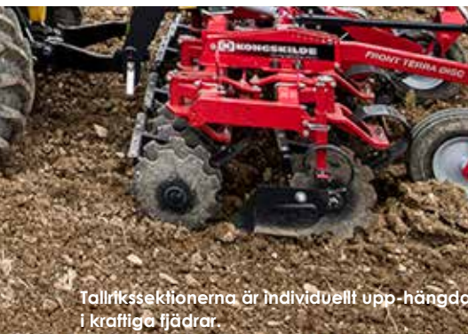
Tallrikssektionerna är individuellt upp-hängda i kraftiga fjädrar.